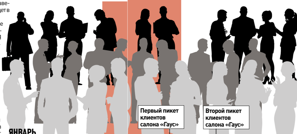
Первый пикет клиентов салона «Гаус»