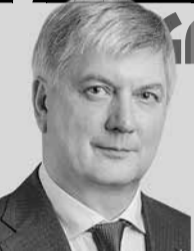
Александр ГУСЕВ, губернатор Воронежской области

К сожалению, мы пока не можем говорить, что у нас наступил перелом или хотя бы стабилизация ситуации. Количество выявленных инфицированных будет возрастать, и это не дает возможности сделать сейчас какие-то дополнительные послабления. Ограничения должны соблюдаться. Самый оптимистичный вариант показывает, что пиковые значения по заболеваемости в регионе наступят с 15 по 20 мая. Пока это просто математические выкладки, но будем надеяться на снижение заболеваемости после этого срока. // НА ЗАСЕДАНИИ ОПЕРАТИВНОГО ШТАБА ПО ПРОТИВОДЕЙСТВИЮ КОРОНАВИРУСА НА ТЕРРИТОРИИ ОБЛАСТИ