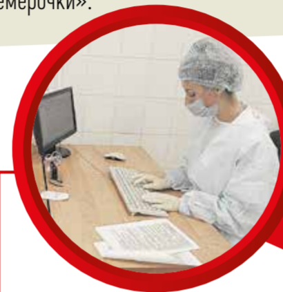
Тренд № 1. Вырос спрос на медперсонал

Распространение коронавируса привело к росту конкуренции на воронежском рынке труда, признали эксперты во время организованного компанией HeadHunter вебинара 23 апреля. Специалисты отметили рост конкуренции и спроса на медицинских сотрудников и курьеров, а также усталость горожан от удаленной работы. Какие еще тренды выявили эксперты, записал корреспондент «Семерочки».