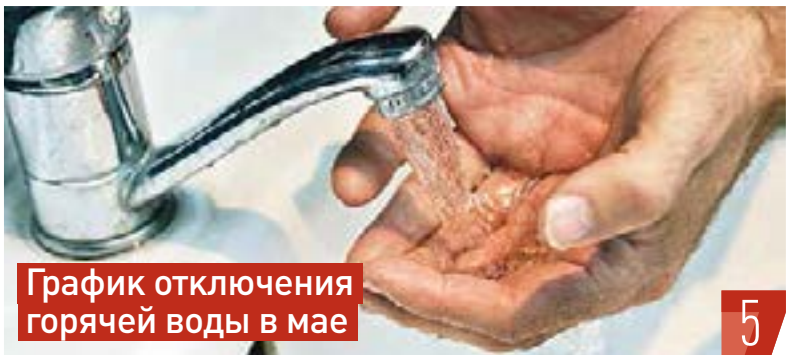
График отключения горячей воды в мае