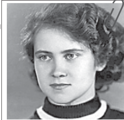
Тамара ЛЮХИНА-ЗАМОТАЙЛОВА (11.05.1939)

СЕМЬ ПРЕДСТАВИТЕЛЬНИЦ СПОРТИВНОЙ ГИМНАСТИКИ, ПРОСЛАВИВШИХ РЕГИОН