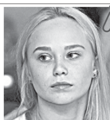
Ангелина МЕЛЬНИКОВА (18.07.2000)