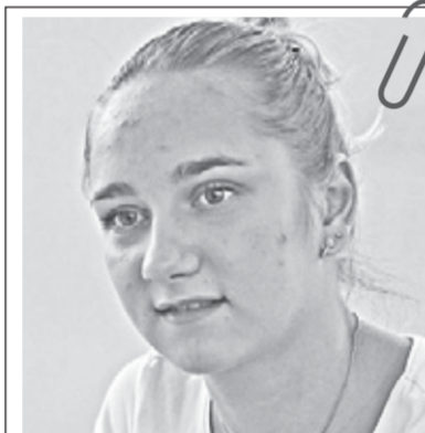
Виктория КОМОВА (30.01.1995)