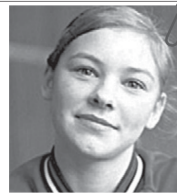
Любовь БУРДА (11.04.1933)