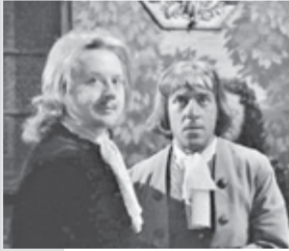
0.25 Сериал «ЧЕЛОВЕК В ПРОХОДНОМ ДВОРЕ»

6.00 «Москва - фронт» 6.25, 9.15 Худ. фильм «НЕ БОЯЙСЯ, Я С ТОБОЙ» 9.00, 13.00, 18.00, 23.00 Новости дня 9.45, 10.05, 13.15, 14.05 Сериал «ХОЗЯЙКА ТАЙГИ - 2. К МОЮ» 10.00, 14.00 Военные новости 18.35 Худ. фильм «ПРИЕЗЖАЯ» 20.35 Худ. фильм «СВЕРСТНИЦЫ» 22.10, 23.15 Худ. фильм «СКАЗ ПРО ТО, КАК ЦАРЬ ПЕТР АРАПА ЖЕНИЛ»