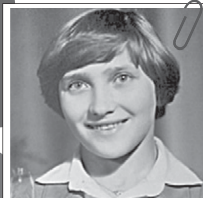
Елена ДАВЫДОВА (7.08.1961)