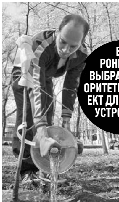
ВОРОНЕЖЦЫ ВЫБРАЛИ ПРИОРИТЕТНЫЙ ОБЪЕКТ ДЛЯ БЛАГОУСТРОЙСТВА

Администрация Воронежа объявила окончательные итоги голосования, в рамках которого горожане выбрали общественную территорию для благоустройства в 2018 году. Наибольшее число голосов — 51% — набрал участок улицы Дмитрова возле дома 107д. Там планируют организовать бульвар. Второе место с 37% голосов занял парк «Орленок». Третье место досталось территории у музея «Арсенал». За нее высказались 12%. Голосование проводилось в рамках акции «Решаем вместе» приоритетного проекта «Формирование комфортной городской среды». На предыдущем этапе голосования лидировал парк «Орленок», за который горожане отдали 1683 голоса. Городская администрация начала прием заявок на благоустройство общественных пространств в Воронеже в середине января-2018. Жители областного центра оставляли заявки в специальных урнах в многофункциональных центрах, управах районов Воронежа, а также в городских ТРЦ. В список самых популярных вошли девять общественных территорий. В итоге было принято почти 18 тыс. пожеланий, по итогам которых выбрали тройку лидеров для окончательного голосования.