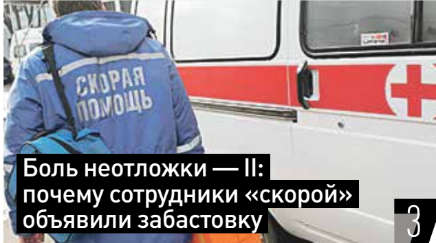
Боль неотложки — II: почему сотрудники «скорой» объявили забастовку