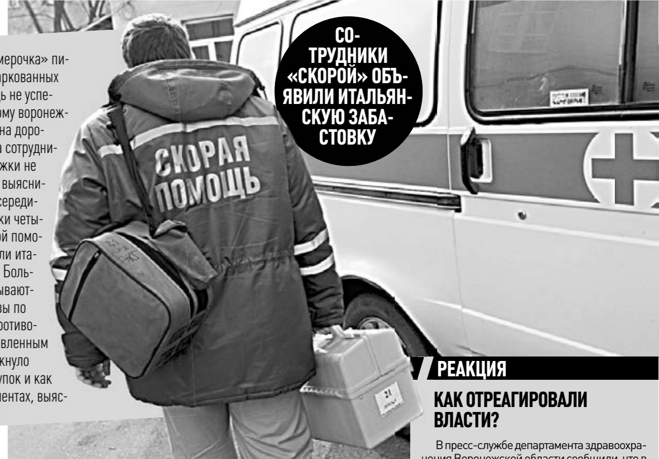
СОТРУДНИКИ «СКОРОЙ» ОБЪЯВИЛИ ИТАЛЬЯНСКУЮ ЗАБАСТОВКУ

Прошлым летом «Семерочка» писала, как из-за припаркованных машин скорая помощь не успела приехать к пожилому воронежцу. Однако хамством на дорогах и нападениями на сотрудников проблемы неотложки не ограничиваются. Как выяснилось недавно, еще в середине февраля сотрудники четырех подстанций скорой помощи Воронежа объявили итальянскую забастовку. Больше месяца они отказываются выезжать на вызовы по одному, так как это противоречит нормам, установленным Минздравом. Что толкнуло врачей на такой поступок и как это отразится на пациентах, выясняла «Семерочка».