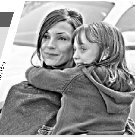
Режиссер — Джон Полсон. В ролях: Роберт Де Ниро, Дакота Фаннинг, Фамке Янссен, Элизабет Шу.

После самоубийства матери маленькая Эмили переезжает на север штата, в новую, спокойную обстановку. Ее отец и психолог Дэвид узнает, что у Эмили появился новый воображаемый друг Чарли. Чарли начинает вести себя все более агрессивно и опасно. Возникает вопрос: а воображаемый ли он? Смертельная игра в прятки начинается.