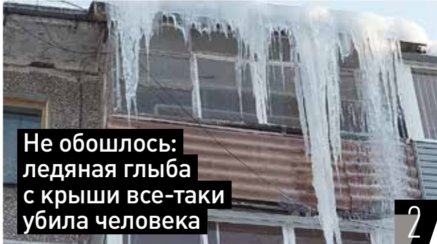
Не обошлось: ледяная глыба с крыши все-таки убила человека