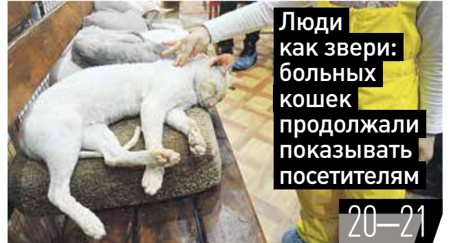
Люди как звери: больных кошек продолжали показывать посетителям