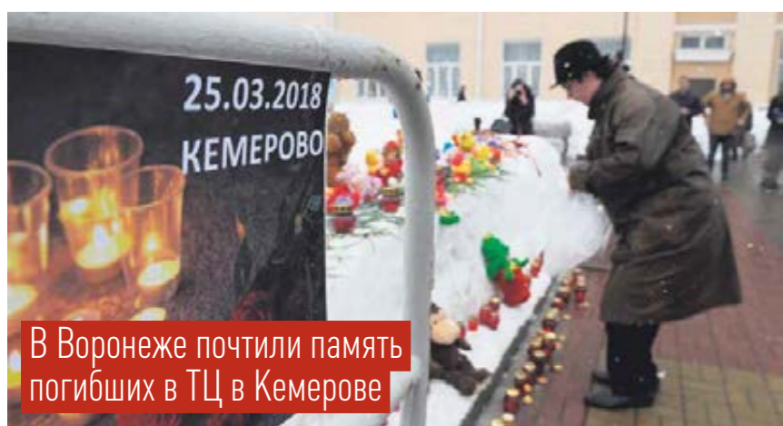
В Воронеже почтили память погибших в ТЦ в Кемерове