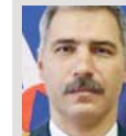
Александр КОШЕЛЬ, начальник ГУ МЧС России по Воронежской области

— С точки зрения пожарной безопасности не логично размещать детские комнаты, кинотеатры, рестораны на верхних этажах. Но надо понимать, что это логично с точки зрения логистики: человек, который идет в кино, пройдет мимо кучи магазинов и оставит там свои деньги. Поэтому у нас практически во всех ТРЦ развлекательные заведения расположены на верхних этажах.