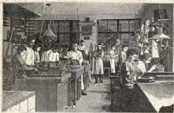
Кондитерская Ф. Ч. Гроссманъ, Воронеж