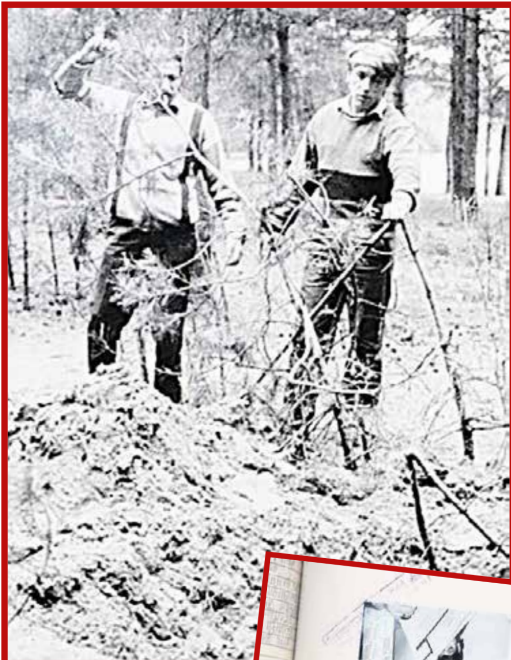
Яма, в которой нашли тело Наташи

«Веруська — выдающийся, исключительный ребенок!» — защищала ее на су-