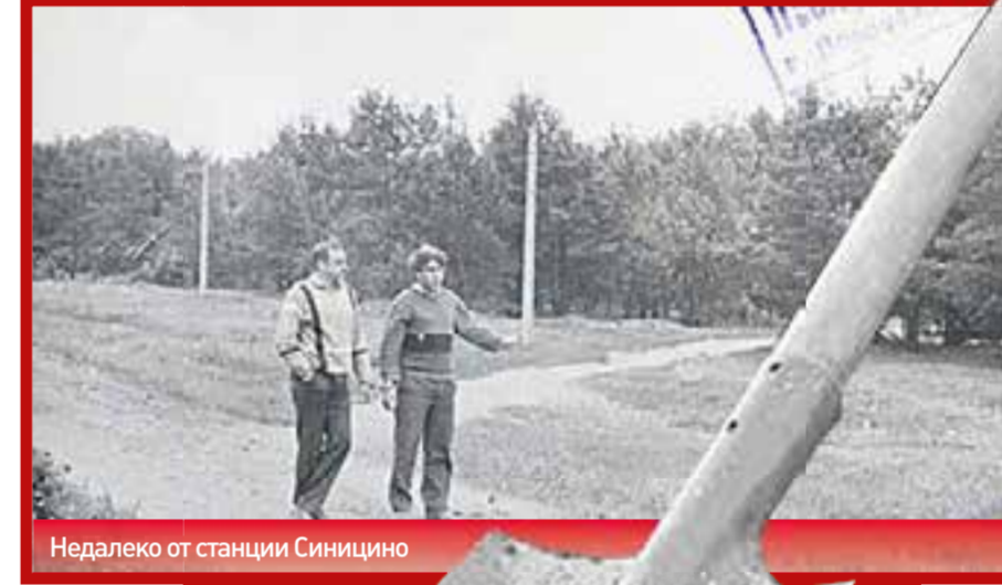
Недалеко от станции Синицино