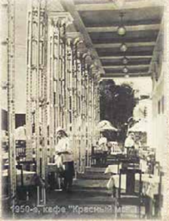
1950-е, кафе "Красный мак"