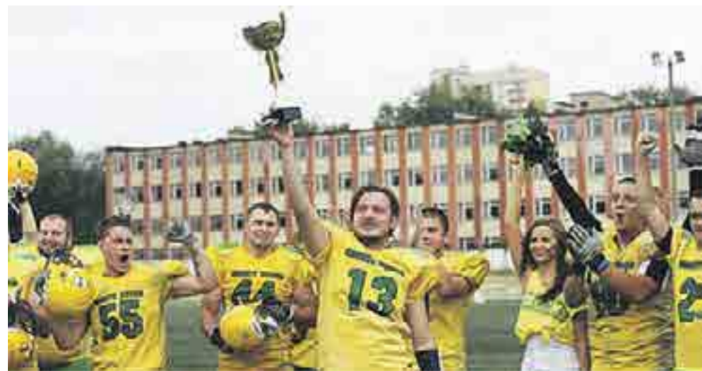
Подготовили: Павел ГОРЯЧЕВ, Людмила МИНАЕВА

— Вы начали турнир с поражения... — Поражения в Минске можно было ожидать. У нас сильно изменились