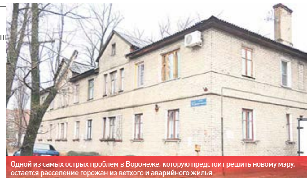
Одной из самых острых проблем в Воронеже, которую предстоит решить новому мэру, остается расселение горожан из ветхого и аварийного жилья