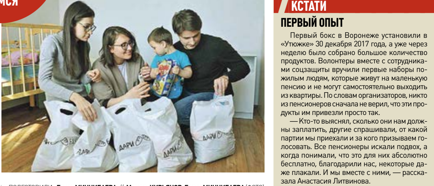
подготовили: Елена МИНИБАЕВА

Защита от воришек Чтобы увидеть, как работает проект «Дари еду!», журналисты «Семерочки» вместе с волонтерами доставили продукты из бокса и подготовили их к передаче.