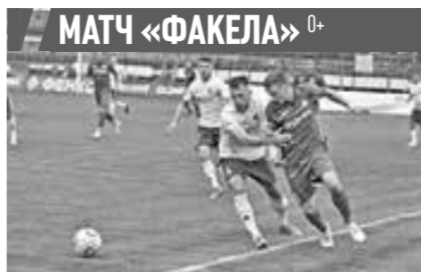
МАТЧ «ФАКЕЛА» 0+ Центральный стадион профсоюзов (ул. Студенческая, 17)

А если будет доказано, что присвоение участка связано с другими правонарушениями, например, мошенничеством или самоуправством, нарушителю может грозить уголовное наказание.