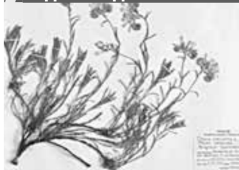
музей им. Крамского (пр. Революции, 18)