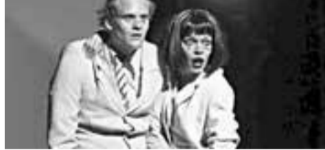
театр драмы им. Кольцова (пр. Революции, 55)