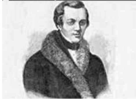
дом-музей Ивана Никитина (ул. Никитинская, 19а)

🕒 с 26 сентября 2019-го по 15 марта 2020 года 💰 60–130 рублей