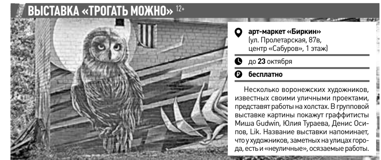
ВЫСТАВКА «ТРОГАТЬ МОЖНО» 12+