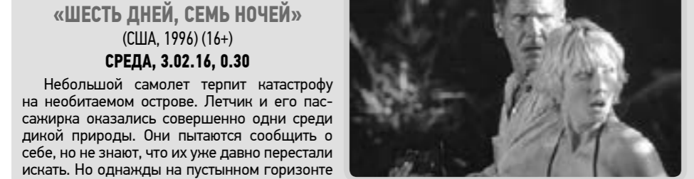
«ШЕСТЬ ДНЕЙ, СЕМЬ НОЧЕЙ» (США, 1996) (16+) СРЕДА, 3.02.16, 0.30 Небольшой самолет терпит катастрофу на необитаемом острове...