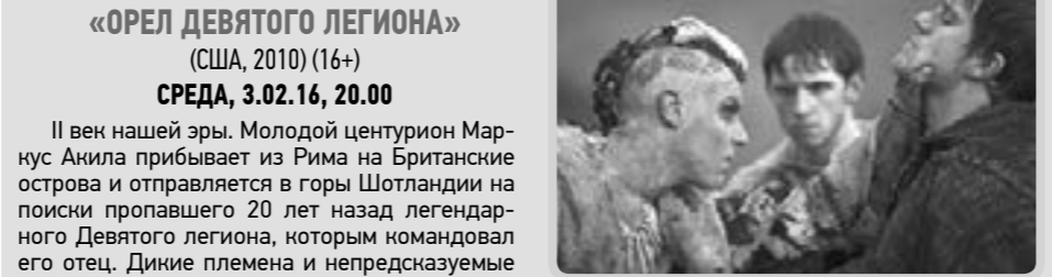
«ОРЕЛ ДЕВЯТОГО ЛЕГИОНА» (США, 2010) (16+) СРЕДА, 3.02.16, 20.00 II век нашей эры. Молодой центурион Маркус Анила прибывает из Рима на Британские острова...